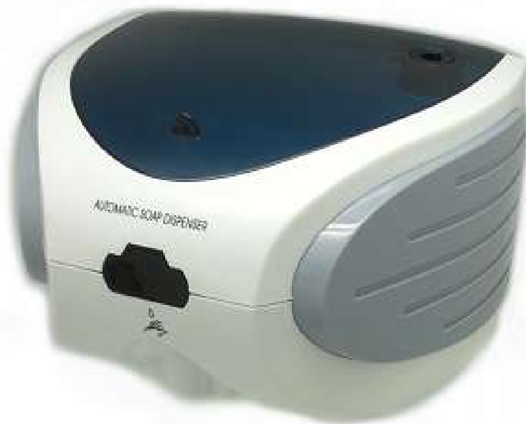
Dispensador de gel con sensor