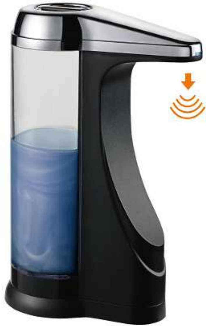
Dispensador de gel con sensor